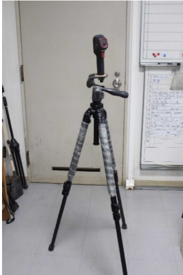
※サーモグラフィー