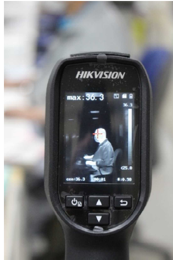
※サーモグラフィー表示画面

〔安心ポイント〕朝の健康チェックに利用できるよう食堂入口付近にサーモグラフィーを設置しています。